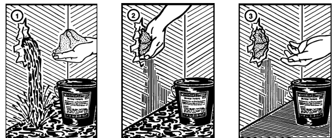
Течовете... ..спират... ..за секунди!

Препоръчваме използването на гумени ръкавици с гладка повърхност, когато работите с KD 2 КЪОСТЕР.